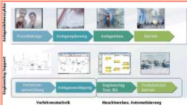
Abb. 1: Phasen im Anlagenlebenszyklus und Toolunterstützung