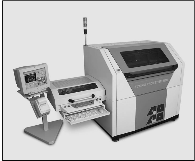
Abb. 2: Flying-Probe-Tester

An jedem Netz werden mehrere Messschritte bei unveränderter Nadelposition gegen ein gemeinsames Bezugspotential (Ground) ausgeführt. Dadurch wird nacheinander das elektrische Verhalten (R/D/C) an allen Netzen der getesteten Baugruppe erfasst. Im Kurzschlussfall liegt mindestens eine Istgröße an mindestens einem der beiden beteiligten Netze außerhalb des Sollbereiches. Nur im Fehlerfall werden für Netze mit fehlerhaften elektrischen Werten die Standard-Shorttestschritte (Testschritte gegen benachbarte Netze) aktiviert, um die Diagnose zu unterstüt-