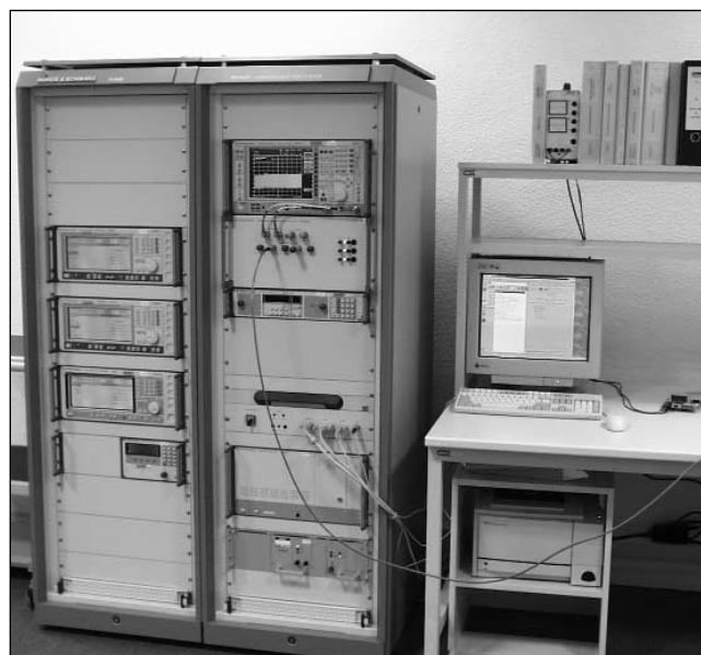
Abb. 1: Bluetooth-HF-Testsystem, TS 8960' von Rohde & Schwarz

▶ Autor Dipl.-Ing. KURT DAMM ist Laborleiter Funk Electronic Technology Systems Dr. Genz GmbH; Storkower Strasse 38 c D-15526 Reichenwalde Fon: 033631/888-0, Fax: 033631/888-640 e-Mail: Damm@ets-bzt.com http://www.ets-bzt.com/homep.htm