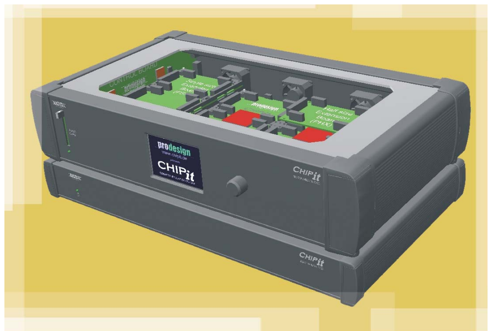
Abb.1: Um den Verifikationsaufwand reduzieren zu können, benötigt der Markt neue Entwicklungswerkzeuge.

Fragt man ASIC-Designer nach den gravierenden Veränderungen in den letzten Jahren so antworten die meisten, dass die ASICs bei immer komplexer werdenden Funktionen und Gatterzahlen in immer kürze-